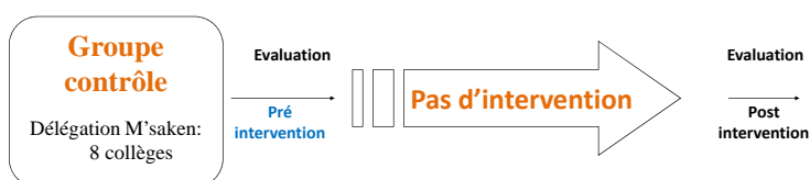
Schéma 1 : schéma de l'étude quasi-expérimentale du programme de la lutte anti-tabac en milieu scolaire dans le gouvernorat de Sousse

Mots clé : tabagisme -élèves -publicité -intervention